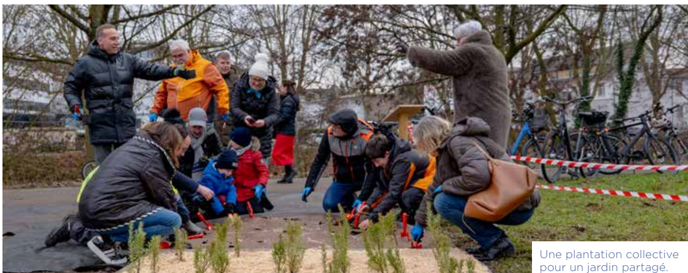
Une plantation collective pour un jardin partagé.

En décembre, élus, agents et porteurs du projet se sont retrouvés au bord de la Moder pour planter les herbes aromatiques de ce nouveau jardin partagé.