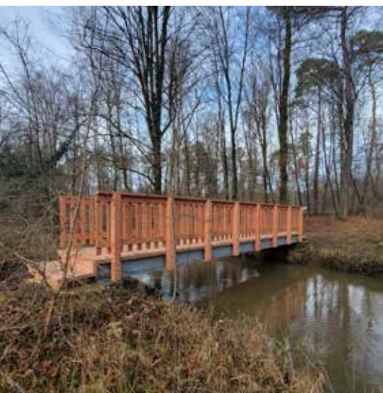
La passerelle qui enjambe l'Eberbach a été remplacée.

Le renouvellement du label « Forêt d'Exception® » pour la forêt indivise de Haguenau permet de poursuivre les actions en cours et d'en engager de nouvelles. Tour d'horizon.