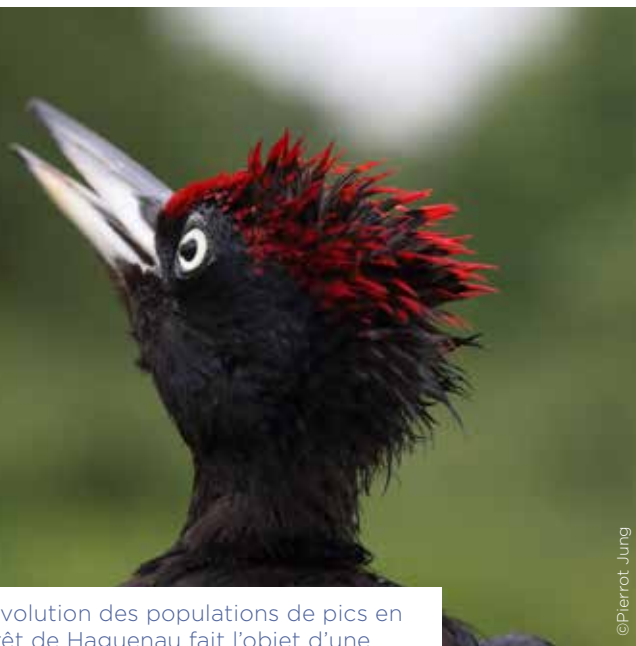
L'évolution des populations de pics en forêt de Haguenau fait l'objet d'une étude au long cours.

Le ban communal de Haguenau est couvert par 140 km 2 de réseau Natura 2000, soit 76,6 % de la surface communale. Des espaces naturels riches d'une biodiversité qu'il convient de préserver.