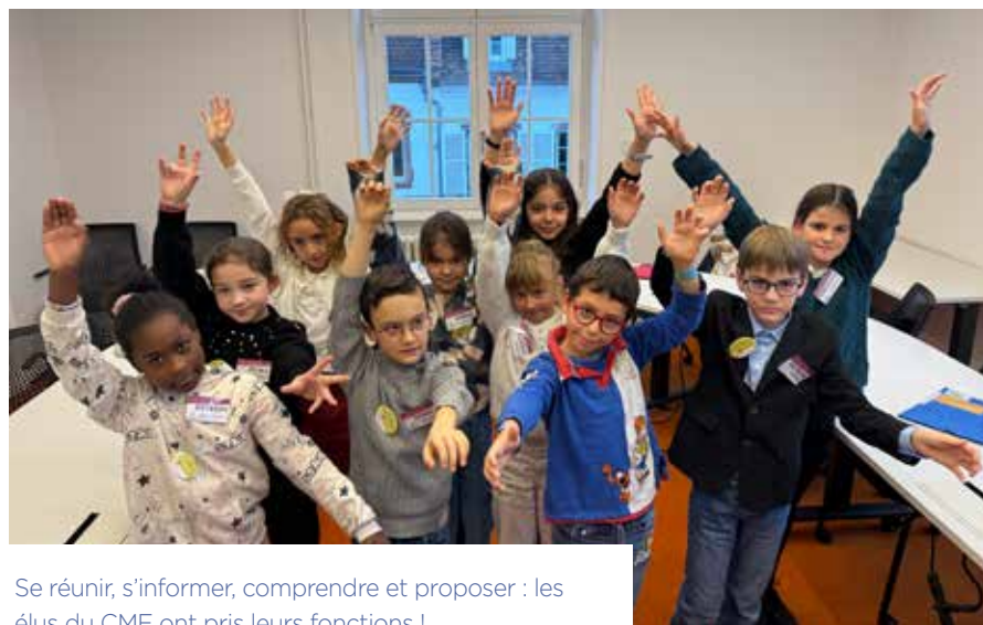
Se réunir, s'informer, comprendre et proposer : les élus du CME ont pris leurs fonctions !

Quatre thématiques, choisies par les enfants, rythmeront le mandat 2025/2027 : l'écologie, la solidarité, le bien-être animal et la mobilité.