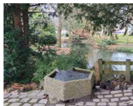
Des pierres naturelles remplaceront le bac en béton d'où s'écoule la cascade.

bien un petit rafraîchissement. Les barrières qui le bordent et qui sont en fin de vie vont être remplacées. Certains végétaux, devenus trop envahissants, seront retirés et remplacés par des plantes ornementales de sous-bois, type bruyères, azalées, rhododendrons, etc. Deux bancs seront également installés pour prendre le temps de la contemplation. Les travaux devraient s'achever fin mars. Petits et grands pourront donc profiter de cet espace restauré dès ce printemps avec le retour des beaux jours !