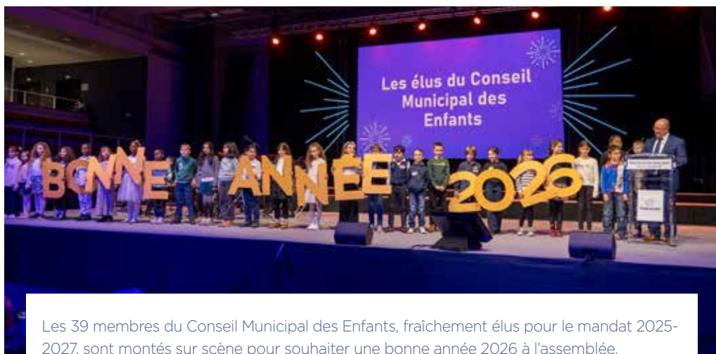
Les 39 membres du Conseil Municipal des Enfants, fraîchement élus pour le mandat 2025-2027, sont montés sur scène pour souhaiter une bonne année 2026 à l'assemblée.