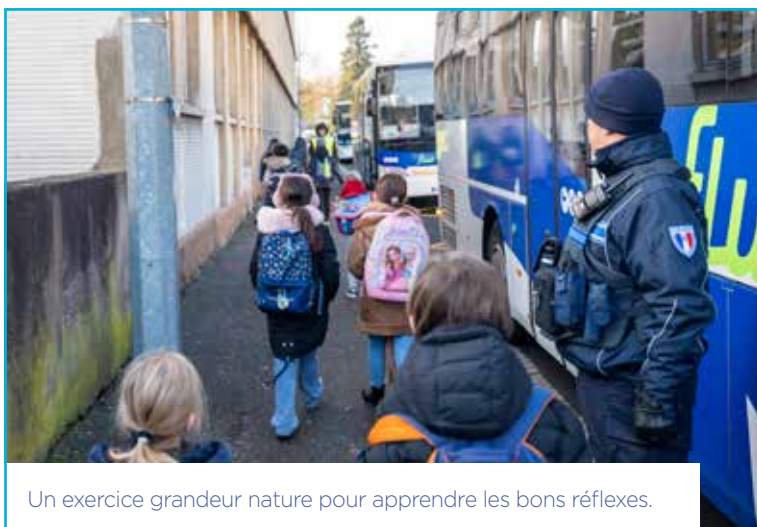
Un exercice grandeur nature pour apprendre les bons réflexes.

routière (PDASR) », indique Yoann Véron, responsable Sécurité routière et modes actifs à la CAH et à la Ville de Haguenau. C'est dans le même cadre que les élèves de CM2 sont formés au centre d'éducation routière, que les collégiens sont sensibilisés au bon usage des vélos et des trottinettes et que les lycéens assistent à une opération crash test. « Cela permet de créer un continuum de rappels à la sécurité tout au long de la scolarité », souligne-t-il.